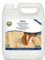
Bote de relleno (4 L.)