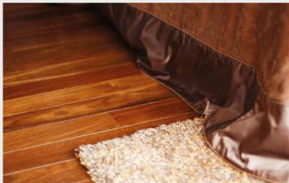
Ejemplo de incidencia de la luz en tarima de Sucupira

La madera natural embellece con el paso del tiempo. Además, una exposición prolongada a la radiación solar desencadena un proceso de fotodegradación u oxidación que se traduce en cambios de tono sobre su color original.