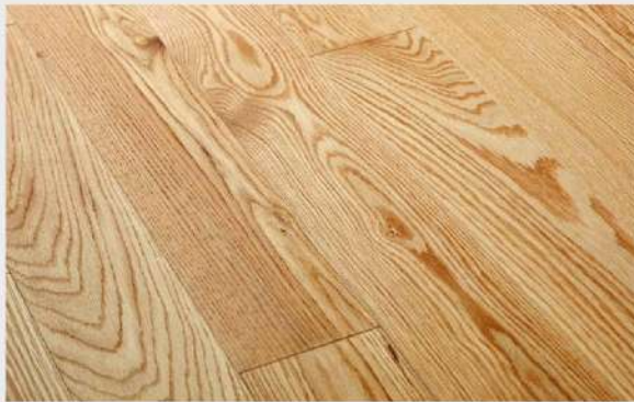
Ejemplo en tarima de madera de Roble

Cada especie de madera presenta un abanico de colores, veteados y texturas singulares que dependen de las propiedades inherentes de la misma. Las diferencias de veteado que puedan existir entre distintas tablas son variaciones aleatorias, que resultan de ser un producto vivo y 100 % natural.