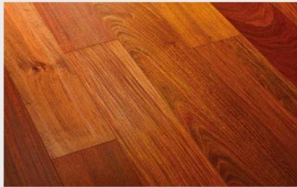
Ejemplo de tarima de Ipe