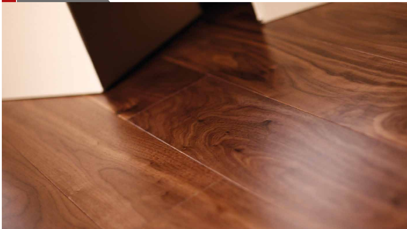
Nogal Americano Tarima de Interior