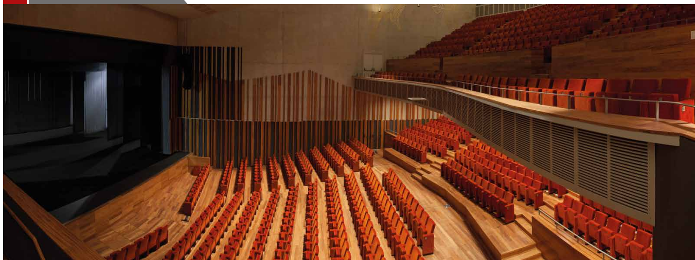
Elondo Tarima de Interior